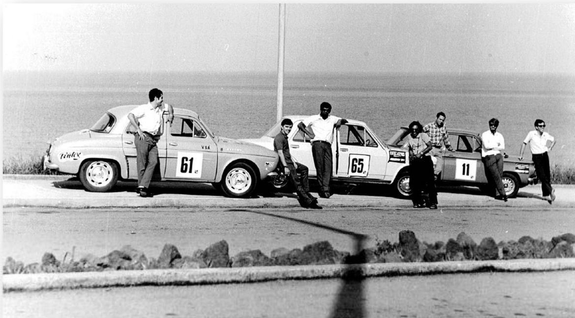
Legenda: Mini Puzzle da Associação Académica de Moçambique.