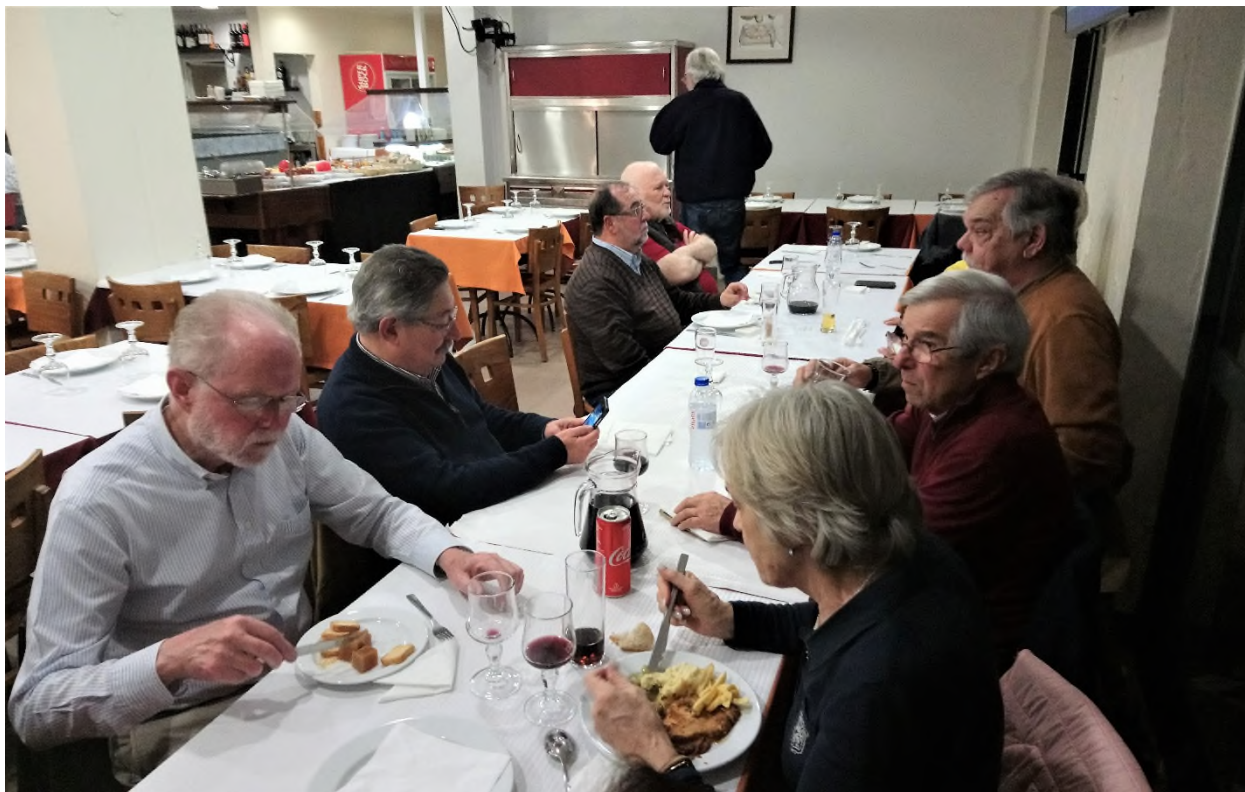
O Couto avalia a consistência do “prato” escolhido.