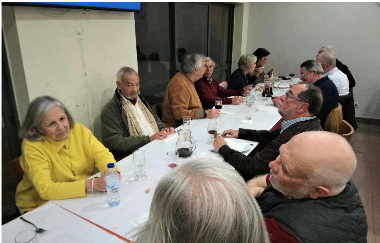
Na ponta Norte da mesa a conversa também é bem apreciada....