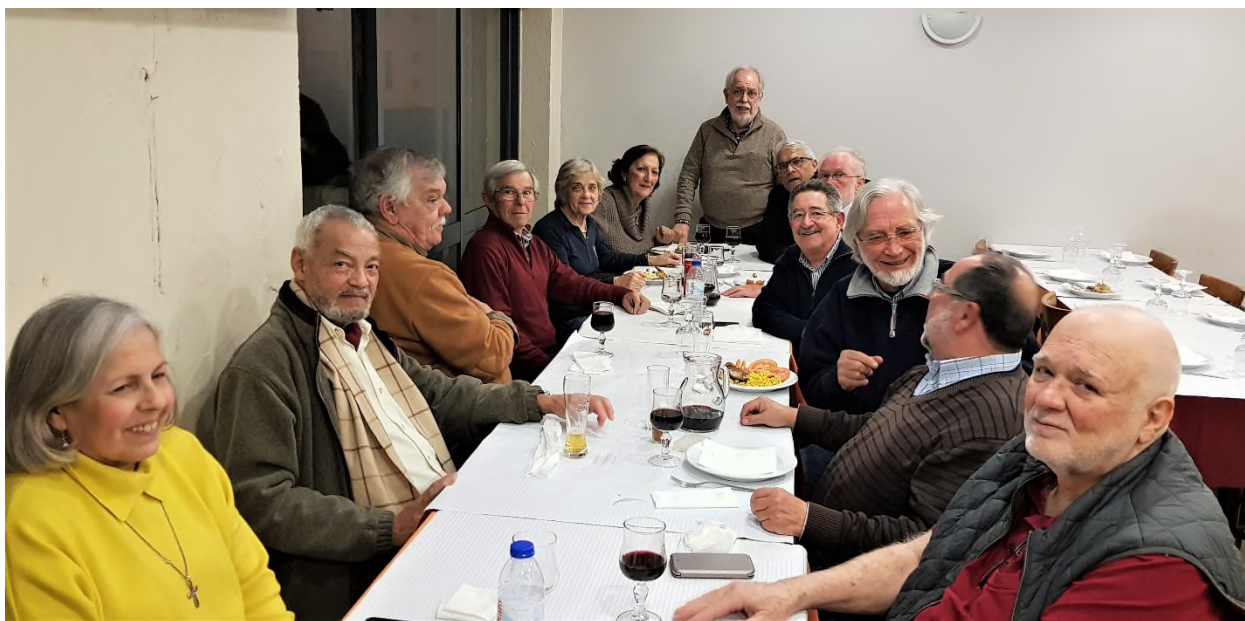
... agora todo o grupo na pose para o passarinho!