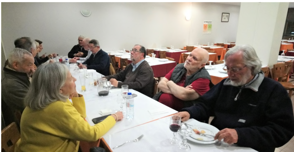
Outra imagem do grupo.