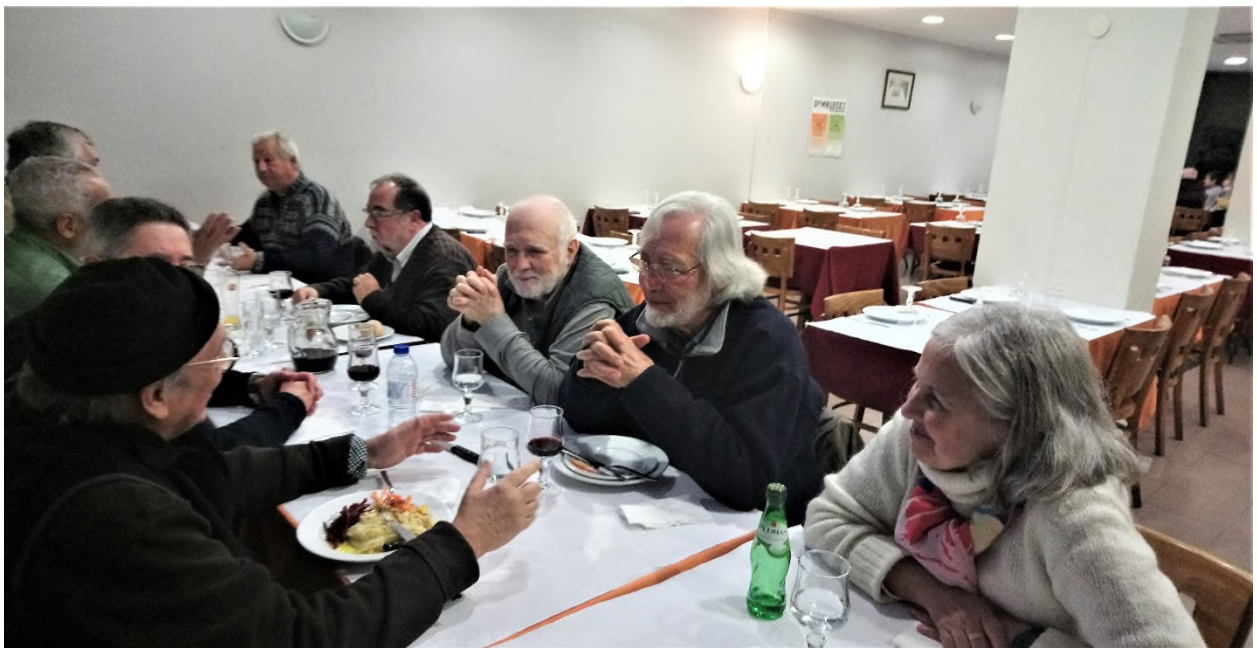
Outra imagem da imagem do grupo.