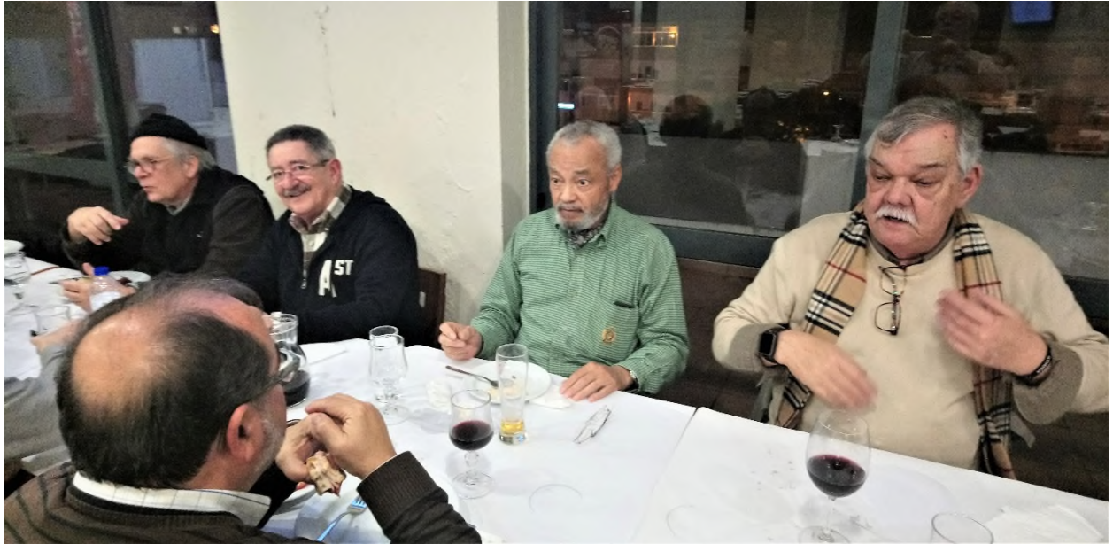
Ambiente de alegria com boas e velhas recordações.