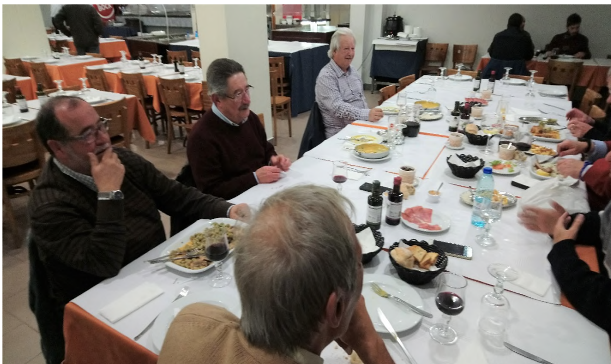
Risada geral na conversa.