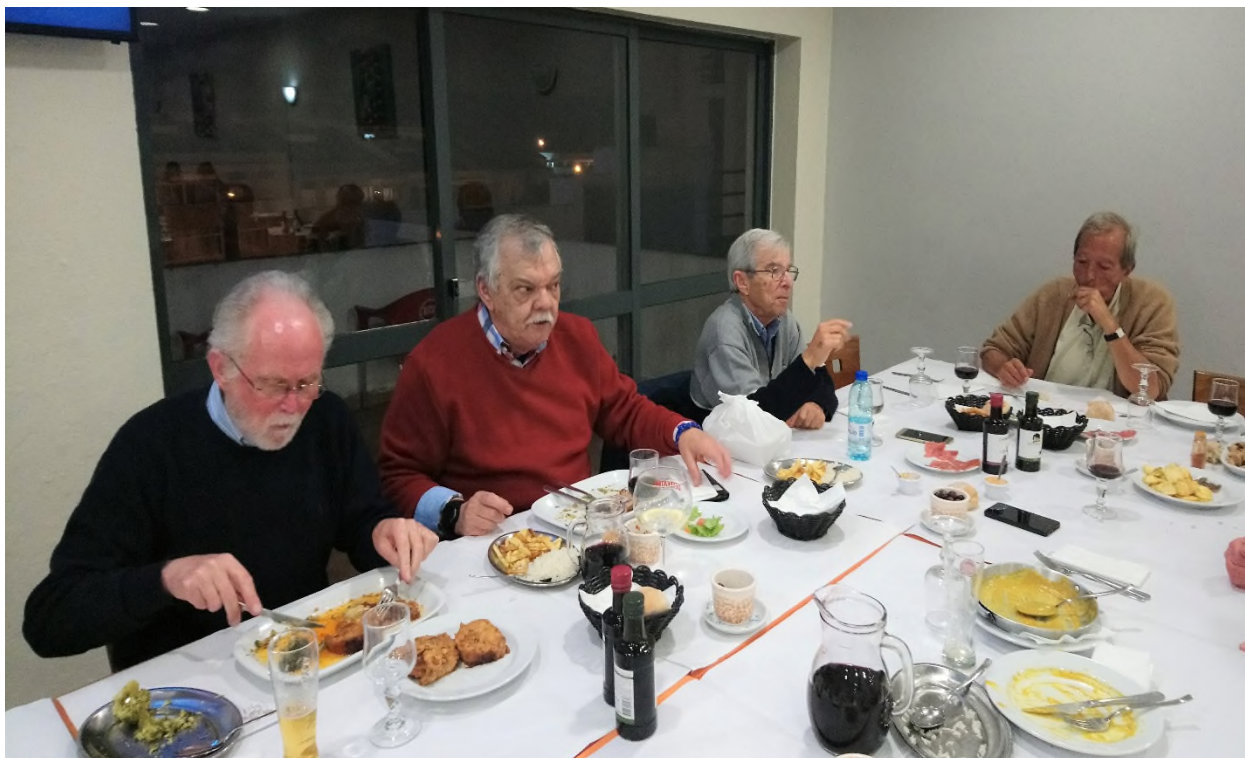
Enquanto uns “atacam o prato” outros ainda aguardam pela comida.