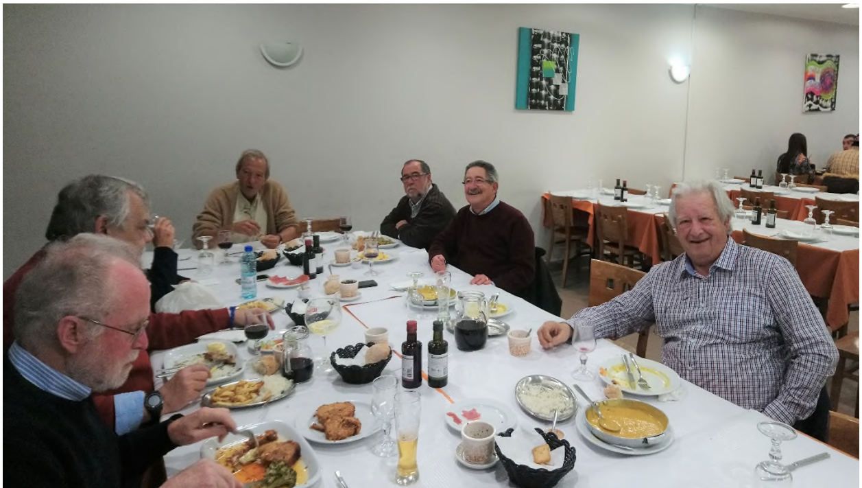
Outra imagem do grupo.